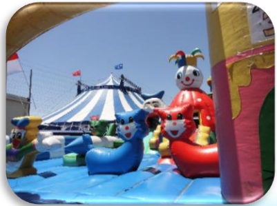
会場は大きなテントです！